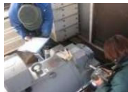
専門技師の機器点検