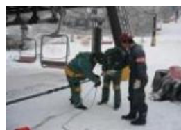
救助用具取扱教育