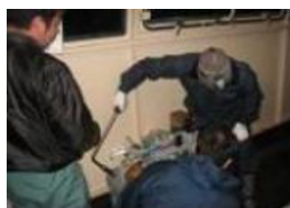
非常時機器取扱訓練