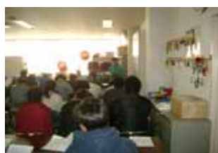
索道従業員講習会